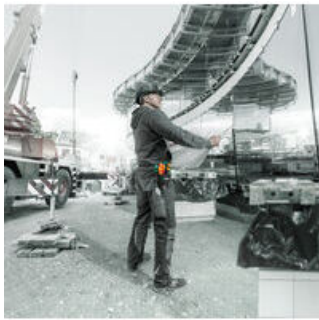
Schraubendrehersätze in Gürteltasche