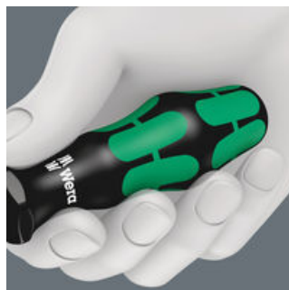
Durch die hervorragend an die Hand angepasste Form des Kraftform-Griffs werden Handverletzungen wie Blasen und Schwielen vermieden. Wera Kraftform: Synonym für begreifbare Ergonomie!