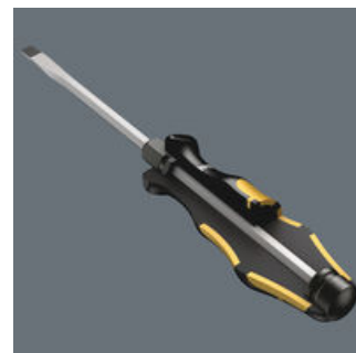
Der Schraubmeißel ist die Lösung, wenn Sie nicht nur schrauben wollen. - Zum Schrauben, Meißeln, Stemmen und Lösen festsitzender Schrauben oder Schraubschellen. Mit integrierter Schlagkappe zur Erhöhung der Lebensdauer und Reduzierung der Splittergefahr. Mit durchgehender Sechskantklinge aus hochwertigem Bits-Material - dadurch verlustfreie Kraftübertragung auch bei Hammerschlägen. Das zähhart vergütete Material verhindert Absplittern oder Bruch der Klinge. Über die integrierte Sechskantschlüsselhilfe können mit Maul- oder Ringschlüssel höhere Drehmomente übertragen werden.