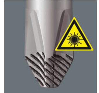
Mittels eng fokussiertem Laserlicht wird eine scharfkantige Oberflächenstruktur erzeugt. Wera Lasertip krallt sich im Schraubenkopf fest und verhindert das Herausrutschen aus dem Schraubenkopf. Bei Schlitz, Phillips und Pozidriv.