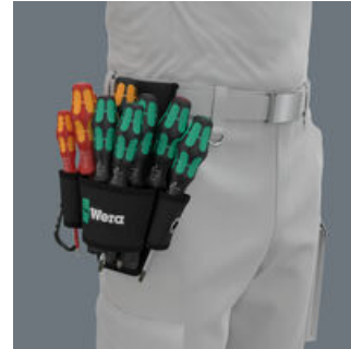
Die Gürtel-Tasche ist aus robustem Material und kann am Gürtel befestigt werden.