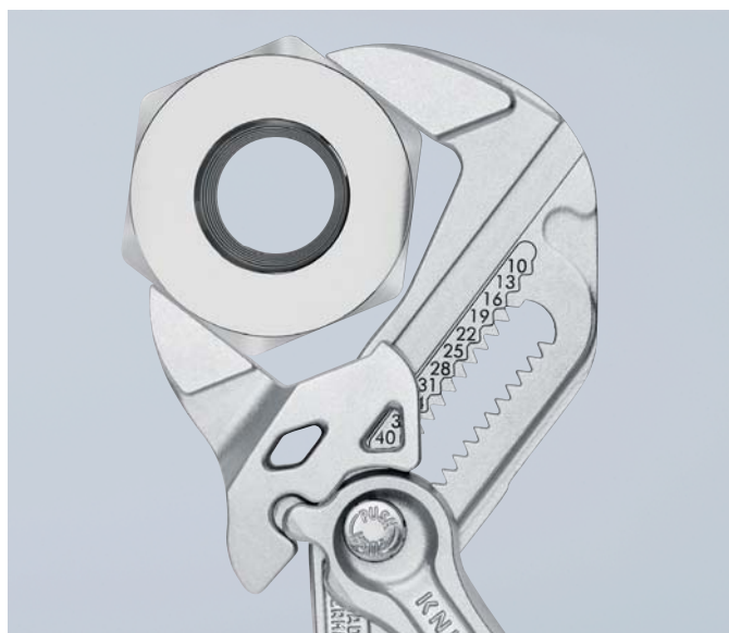
Schlüsselweite metrisch (Vorderseite) und zöllig (Rückseite) am Zangenkopf eingelastet