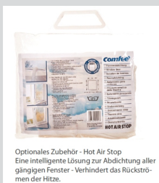
Optionales Zubehör - Hot Air Stop Eine intelligente Lösung zur Abdichtung aller gängigen Fenster - Verhindert das Rückströmen der Hitze.

Midea Europe GmbH Ludwig-Erhard-Straße 14 65760 Eschborn Deutschland