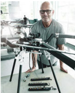
Die Wera Belts