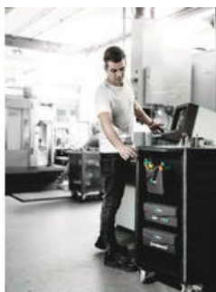
Wera 2go 4 Köcher