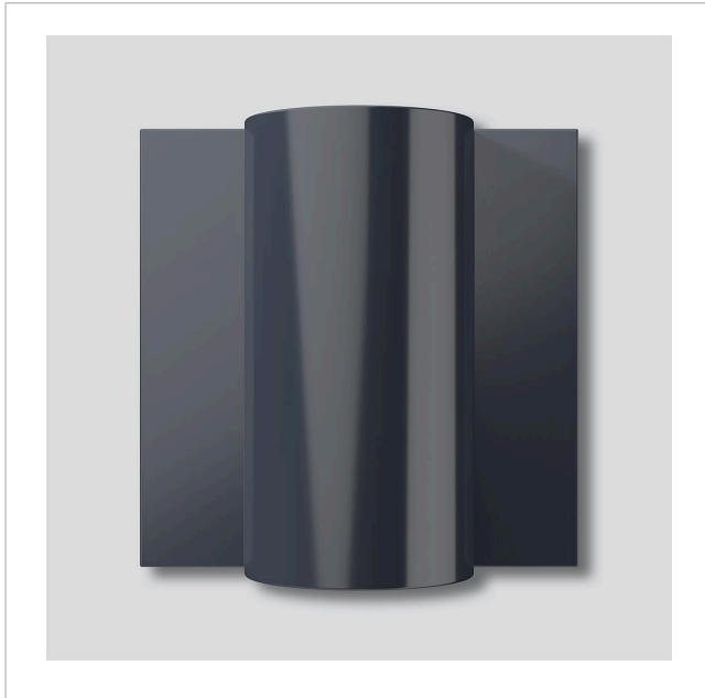
LED-Spot LEDS 600-0 AG 210004990-00