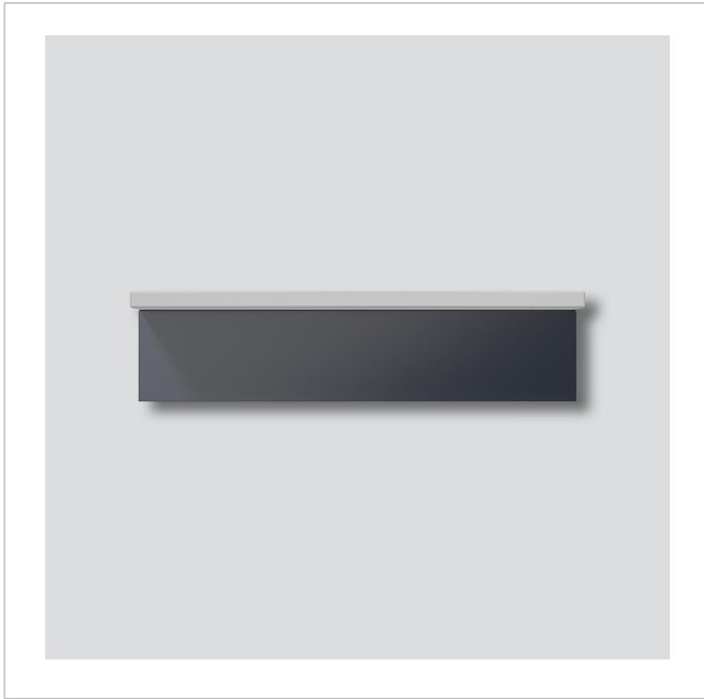
LED-Flächenleuchte LEDF 600-4/1-0 AG