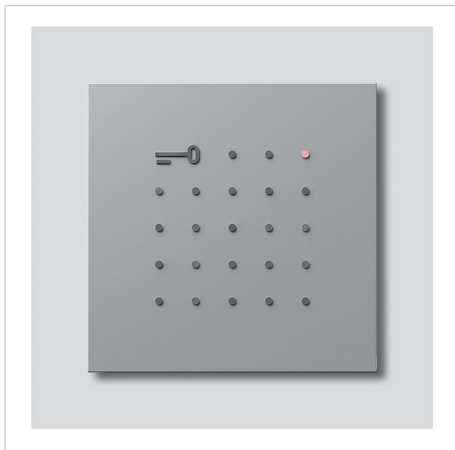
Electronic-Key-Lese-Modul ELM 600-0 SM 210008428-00