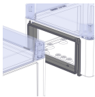
140000250 Polyester Verbindungsflansch