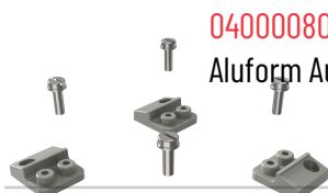
040000800 Aluform Außenbefestigungssteg 80