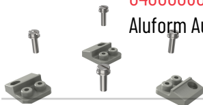
040000800 Aluform Außenbefestigungssteg 80