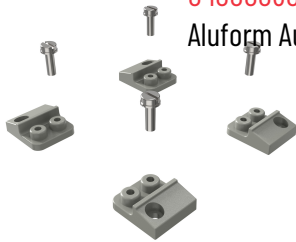
040000800 Aluform Außenbefestigungssteg 80