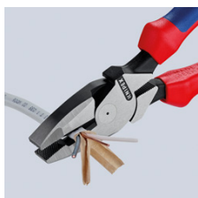
Lange Schneiden zum Trennen von flachen Kabeln

Technische Änderungen und Irrtümer vorbehalten