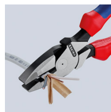
Lange Schneiden zum Trennen von flachen Kabeln