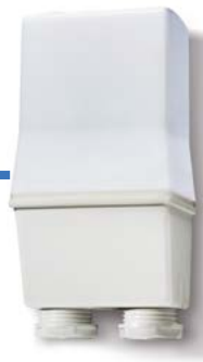
Bluetooth GPS Antenne Typ 012.BG.8.230