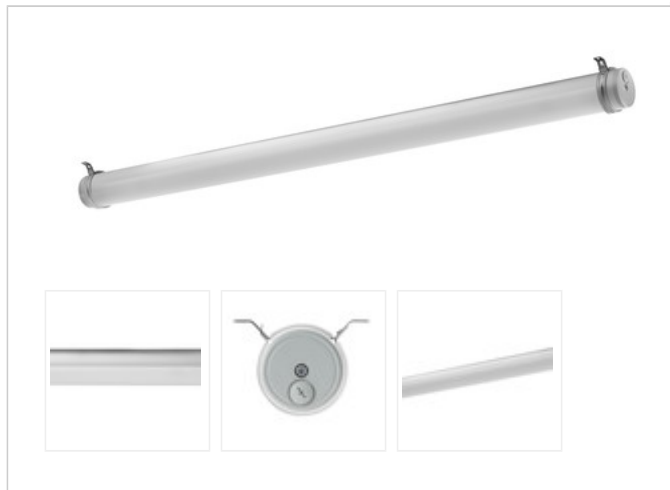
TUBIS N LED