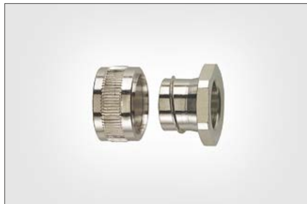
HelaGuard SC-PC Einführungsbuchse.