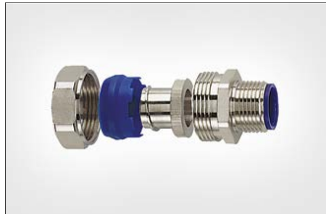
HelaGuard LTS-FMC Kompressionsverschraubung.

Weitere Verschraubungen mit PG- und drehendem Gewinde auch verfügbar. Für mehr flexible Kabelschutzschläuche und Verschraubungen, siehe den HelaGuard-Katalog.