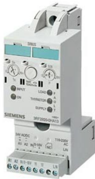
LEISTUNGSREGLER STROMBEREICH 50A 40 GRAD C 110-230V / 24V AC/DC FUER HALBLEITERRELAIS / SCHUETZ