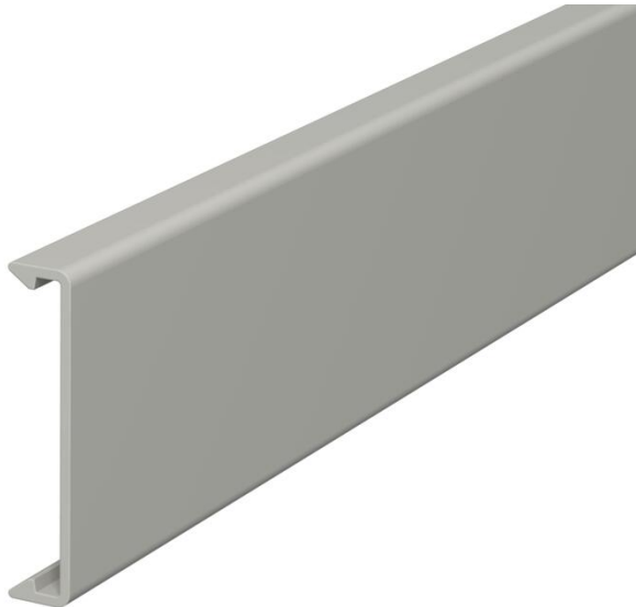
Oberteil zum Verschließen der Kanäle.