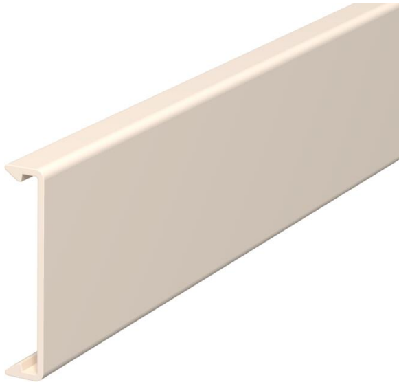
Oberteil zum Verschließen der Kanäle.