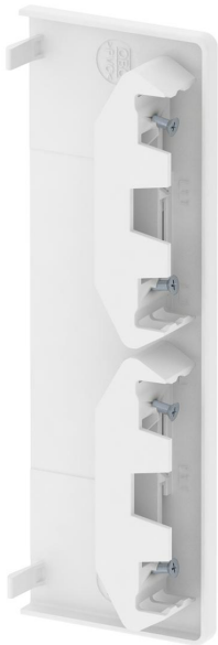
Endstück zum Verschließen der GK Geräteeinbaukanäle.